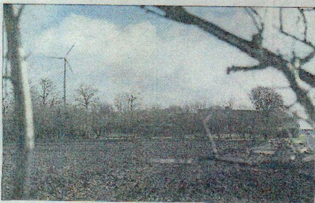
Møllen skal flyttes 80 meter for at blive lovlig i forhold til flyvepladsen, men så kommer den for langt væk fra bygningerne.

- Da vi oprettede banen, blev vi enige med kommu-